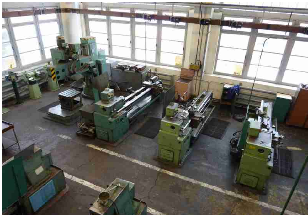
Dílňa odborného výcviku