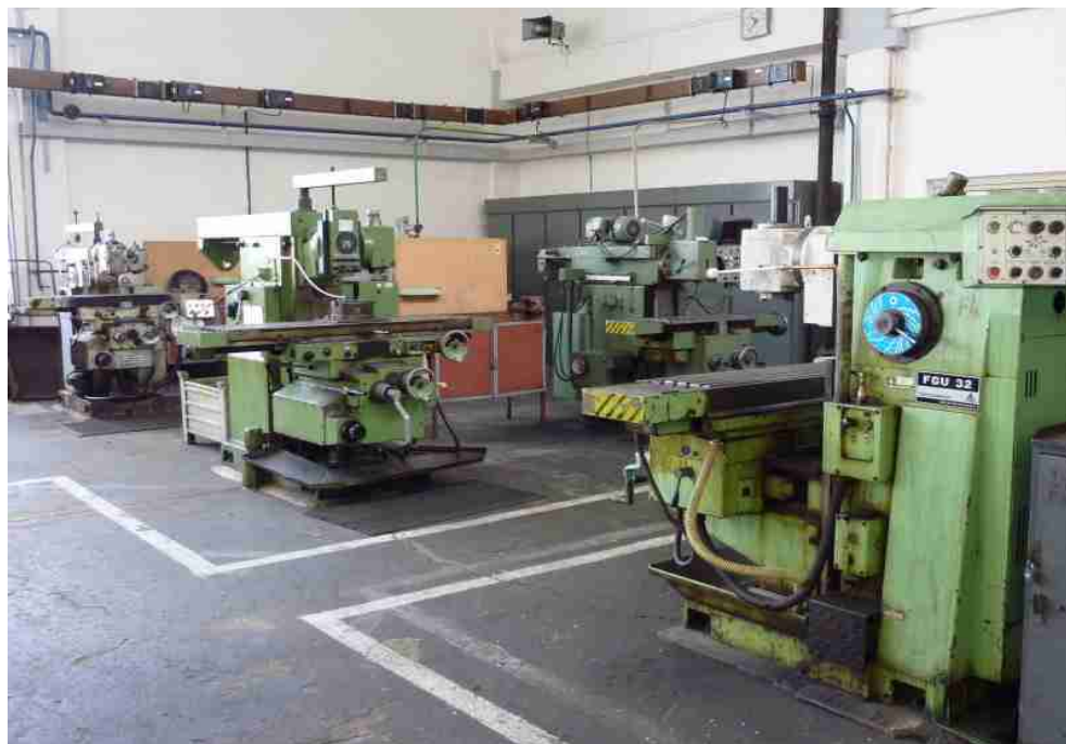
Dílňa odborného výcviku