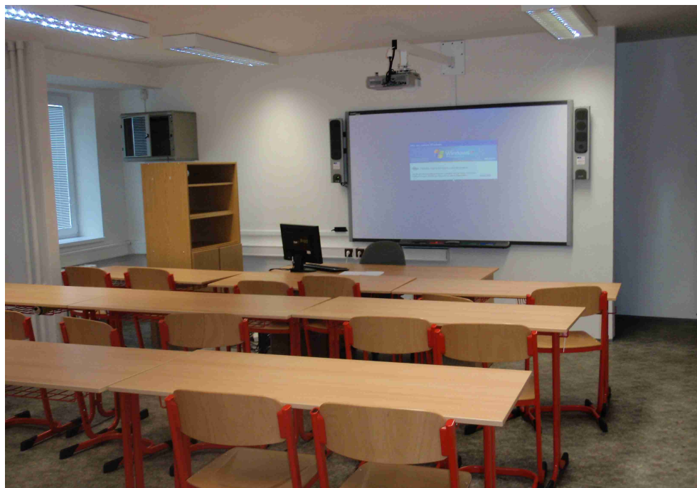
Učebna E509 s interaktivní tabulí