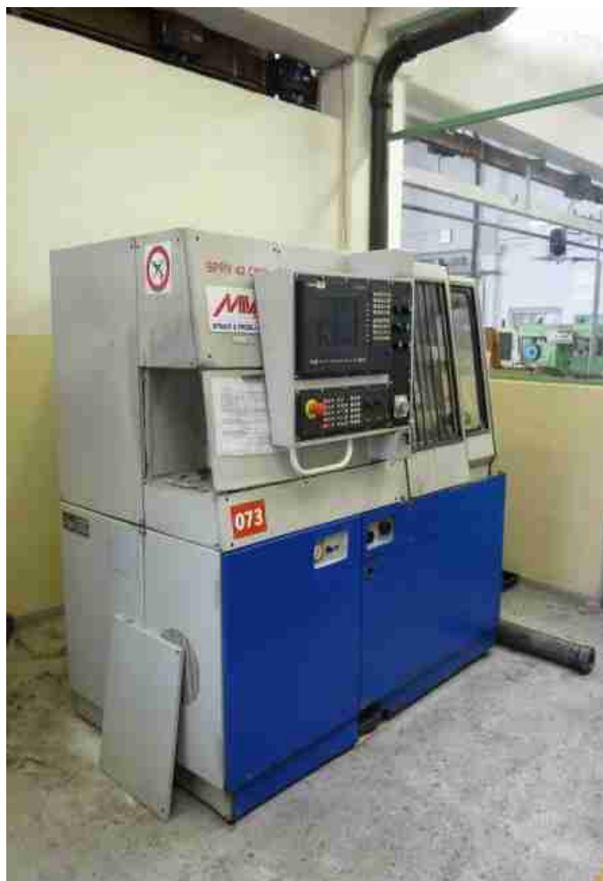
Dílňa odborného výcviku